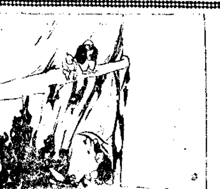
—Oiga, caballero, dígame a mí hijo qué es lo que desea usted, porque es que yo soy un poco sordo, ¿sabe?