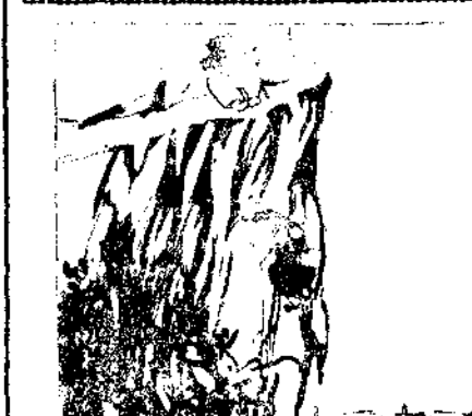
—¡Auxilio! ¡Por María Sanísima! Socorro. Una cuerda, por favor. ¡¡Pronto!!