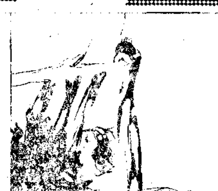
—Que llegue a tiempo, Dios mío!