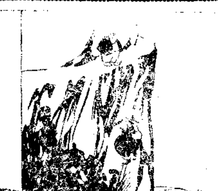
—Espere un momento.